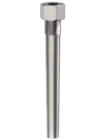
Pozzetto da barra rastremato